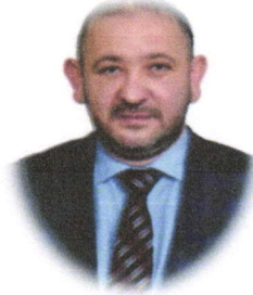
Behçet ÖZKUL AK PARTİ