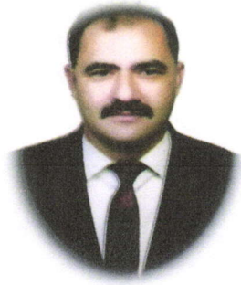
Erkan KARA Belediye Başkanı AK PARTİ