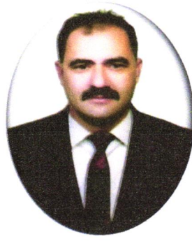
Erkan KARA Belediye Başkanı AK PARTİ