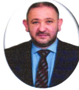
Behçet ÖZKUL AK PARTİ