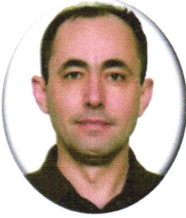
Mustafa GÜL AK PARTİ