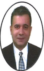
Gökhan YILDIZEL İYİ PARTİ