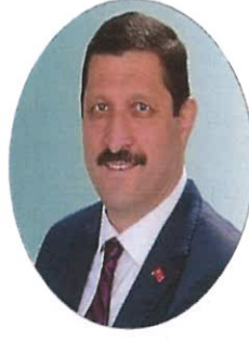
Selami SELÇUK Belediye Başkanı AK PARTİ