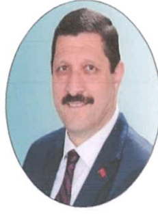
Selami SELÇUK Belediye Başkanı AK PARTİ