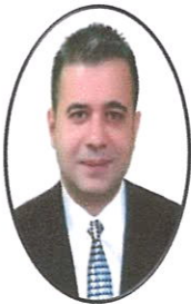
Gökhan YILDIZEL İYİ PARTİ